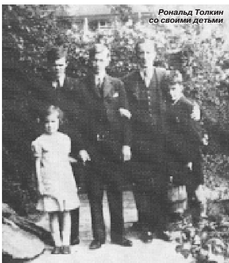
Рональд Толкин со своими детьми

Потекла мирная жизнь примерного семьянина и подающего надежды молодого преподавателя. Эдит родила ему троих